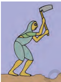
श्रम सभी संपत्तियों का स्रोत है।

उत्खनन सहित कृषि (जिसे प्राथमिक क्षेत्रक भी कहते हैं) और विनिर्माण (जिसे द्वितीयक क्षेत्रक भी कहते हैं), इन दो क्षेत्रकों के बीच उत्पादन-गतिविधियों का विभाजन आर्थिक विकास का संभवतः प्रथम दृष्ट स्वरूप था। यह विभाजन 'श्रम-विभाजन' की प्रक्रिया के माध्यम से हुआ। यह नाम अर्थशास्त्र के जनक एडम स्मिथ द्वारा दिया गया था। इस प्रक्रिया की संक्षिप्त व्याख्या नीचे की गई है।