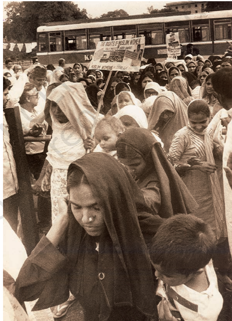
अपने अधिकारों की माँग करती हुई औरतें

है जो हम सभी को एक भारतीय के रूप में जोड़ती है। प्रत्येक व्यक्ति को समान अधिकार और समान अवसर प्राप्त हैं। अस्पृश्यता यानी छुआछूत को अपराध की तरह देखा जाता है और इसे कानूनी रूप से खत्म कर दिया गया है। लोग अपनी पसंद का काम चुनने के लिए बिल्कुल आज़ाद हैं। नौकरियाँ सभी लोगों के लिए खुली हुई हैं। इन सबके अलावा संविधान ने सरकार पर यह विशेष ज़िम्मेदारी डाली