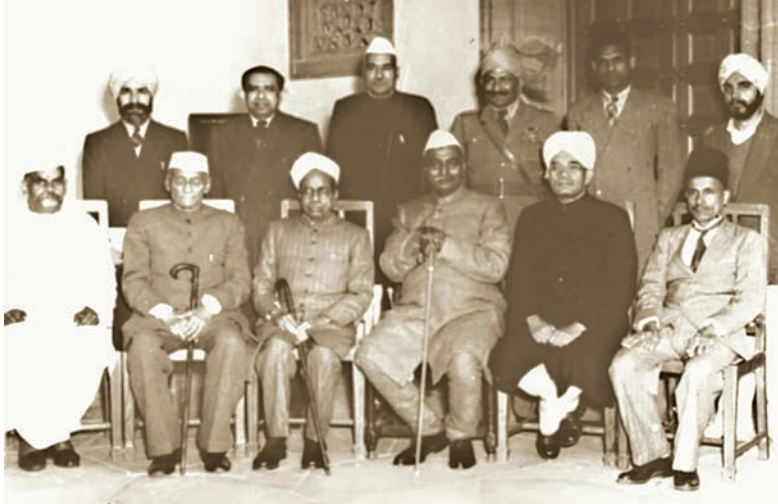
भारत का संविधान लिखने वाली समिति के कुछ सदस्य

थी कि वह गरीबों और मुख्यधारा से अलग-थलग पड़ गए समुदायों को इस समानता के अधिकार के फायदे दिलवाने के लिए विशेष कदम उठाए।