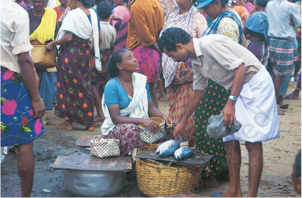
स्थानीय बाज़ार में मछलियाँ बेचती हुई मछुआरिनें