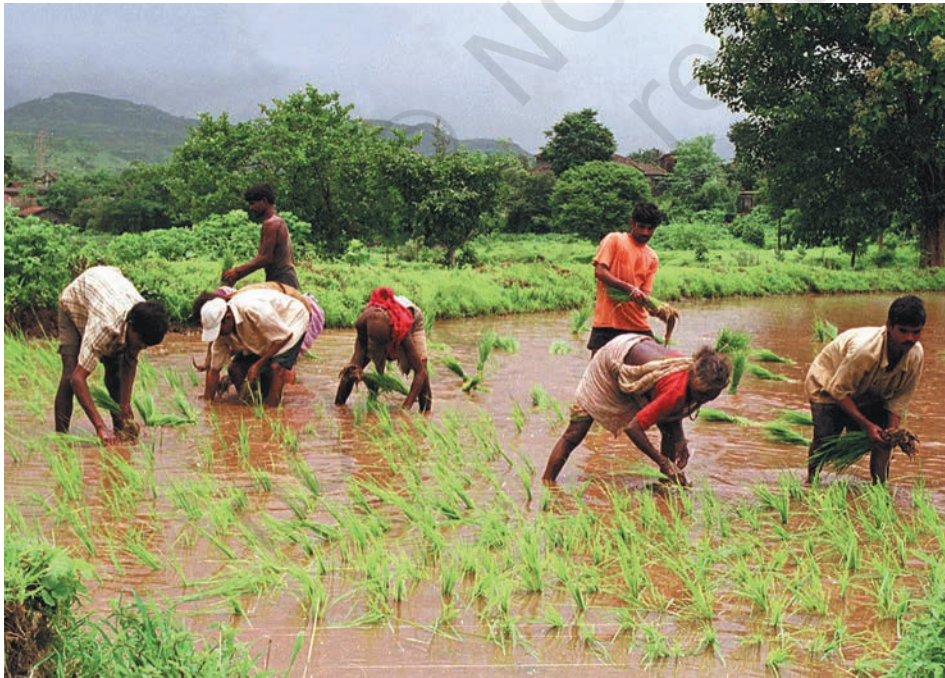
धान की रोपाईं कमरतोड़ काम होता है

कलपट्टु में कुछ लोग नर्स, शिक्षक, धोबी, बुनकर, नाई, साइकिल ठीक करने वाले और लोहार के रूप में अपनी सेवाएँ देते हैं। यहाँ कुछ दुकानदार एवं व्यापारी भी हैं। जो मुख्य गली है वह बाज़ार की तरह दिखती है। उसमें आपको तरह-तरह की कई छोटी दुकानें दिखेंगी, जैसे — चाय, सब्जी, कपड़े की दुकान तथा दो दुकानें बीज और खाद की। चार दुकानें चाय की हैं जहाँ 'टिफ़िन' भी मिलता है। यहाँ