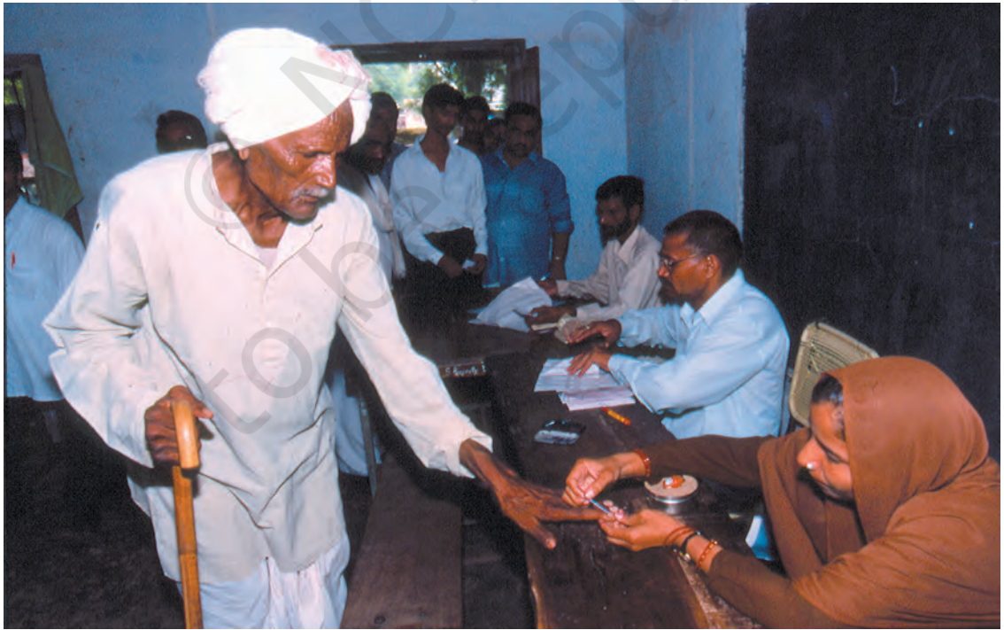
دیہی علاقے میں ووٹ دینے کا عمل: انگلی پر نشان لگایا جا رہا ہے تاکہ یہ یقینی بنایا جاسکے کہ ایک شخص صرف ایک ہی ووٹ ڈالے۔

آزادی سے پہلے ہندوستان میں ایک بہت ہی چھوٹی سی اقلیت کو ووٹ دینے کی اجازت تھی۔ اس لیے وہ مل کر