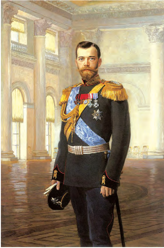
شکل 3: ونزویلے کے وہاٹ ہال میں زار نکولس دوم۔ ایس۔ ٹی پریس برگ 1900 آر نیٹ لپگارٹ کی پینٹنگ

بیسویں صدی کی ابتدا تک روسی باشندوں کی ایک بڑی اکثریت زراعت پیشہ تھی روسی سلطنت کی کل