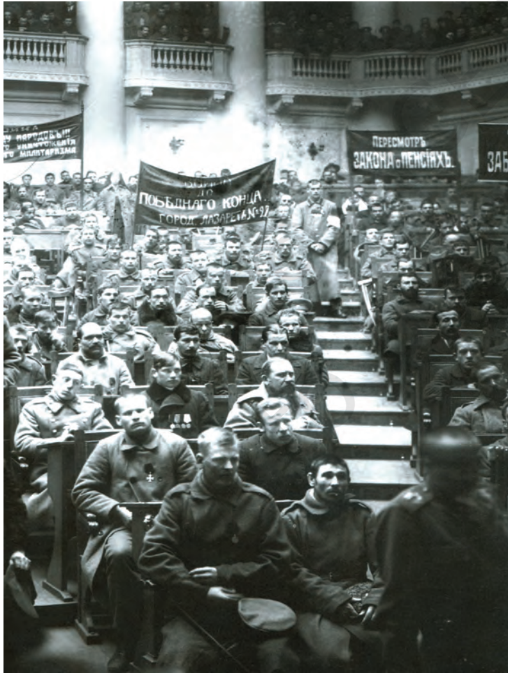
شکل 8: ڈیوما میں اجلاس کرتے ہوئے پیٹر وگراڈ سوویت، فروری 1917

گزر کر راجدھانی کے مرکز نیوسکی پراسپیٹ تک جا پہنچے۔ یہ وہ مرحلہ تھا جب کوئی بھی سیاسی پارٹی پوری سرگرمی سے تحریک کو منظم نہیں کر رہی تھی۔ جوں ہی فیشن اہیل رہائش گاہوں اور سرکاری عمارتوں کو مزدوروں نے گھیرا حکومت نے کرفیو نافذ کر دیا۔ شام تک مظاہرین متزجر ہو گئے لیکن 24 اور 25 فروری کو وہ واپس لوٹ آئے۔ حکومت نے مظاہرین پر نظر رکھنے کے لیے اسپ سوار فوج اور پولیس بلا لی۔ اتوار 25 فروری کو حکومت نے ڈیوما کو معطل کر دیا۔ اس اقدام کے خلاف سیاسی رہنماؤں نے اپنی آواز بلند کی۔ مظاہرین 26 فروری کو ندی کے بائیں کنارے پر واقع گلیوں میں پوری طاقت کے ساتھ لوٹ آئے۔ 27 فروری کو پولیس ہیڈ کوارٹر پر لوٹ مار ہوئی گلیاں لوگوں سے اٹی پڑی تھیں لوگ روٹی، اجرتوں، کام کے بہتر گھنٹوں اور جمہوریت کے بارے میں نعرے لگا رہے تھے۔ حکومت نے صورت حال پر قابو پانے کی کوشش کی اور اس مسئلہ کے حل کے لیے اسپ سوار فوج بلا لی گئی۔ تاہم اسپ سوار فوج نے مظاہرین پر گولی چلانے سے انکار کر دیا۔ رجمنٹ کی بیروں میں ایک افسر کو گولی مار دی گئی اور تین دوسری فوجی ٹکڑیوں نے بغاوت کر دی اور ہڑتالی مزدوروں کا ساتھ دینے کا عہد کیا۔ شام تک فوجی اور ہڑتالی مزدور اسی عمارت میں جہاں ڈیوما کا اجلاس ہوتا تھا، سویت یا کونسل بنانے کے لیے جمع ہوئے۔ یہ پیٹر وگراڈ سوویت تھی۔