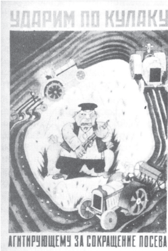
شکل 18: اجتماعیت کاری کے دوران ایک پوسٹر اس میں لکھا ہے۔ ”کاشتکاری کو گھٹانے پر مصرح مہلاک پر ہم وار کریں گے۔“

ابتدائی منصوبہ بند معیشت کا زمانہ زراعت کی اجتماعیت کاری کی تباہیوں سے وابستہ تھا۔ 1927-28 کے زمانے تک سویت روس کے قصبات اناج سپلائی کے سنجیدہ مسئلے کا مقابلہ کر رہے تھے۔ حکومت نے اناج کے فروخت کی قیمتوں کا تعین کر دیا لیکن ان مقررہ قیمتوں پر کسانوں نے سرکاری خرید کرنے والوں کے ہاتھ اپنا اناج فروخت کرنے سے انکار کر دیا۔