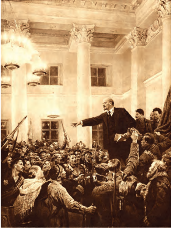
شکل 9: اپریل 1917 میں مزدوروں کو خطاب کرتے ہوئے لینن کی باشوکی شیبہ۔

پورے گرمیوں کے موسم میں مزدور تحریک طول و عرض میں پھیل گئی۔ صنعتی علاقوں میں ایسی فیکٹری کمیٹیوں کی تشکیل کی گئی جنہوں نے صنعت کاروں کے کارخانوں سے وابستہ طریقہ کار پر سوال کرنا شروع کیے۔ ٹریڈ یونینوں کی تعداد میں اضافہ ہوا۔ فوج میں سپاہیوں کی کمیٹیاں بنائی گئیں۔ جون میں 500 سوویتوں نے کل روسی کانگریس میں اپنے نمائندے بھیجے۔ جب عارضی حکومت نے اپنی طاقت گھٹنے اور باشوکی اثر کو بڑھتے دیکھا تو اس نے پھیلتی بے اطمینانی کے خلاف سخت اقدامات اٹھانے کا فیصلہ کیا۔ اس نے کارخانوں کو چلانے میں مزدوروں کی کوششوں کے خلاف مدافعت شروع کی اور لیڈروں کو گرفتار کرنا شروع کر دیا۔ جولائی 1917 میں باشوکیوں کے ذریعہ چلائے گئے عوامی مظاہروں کو سختی سے دبا گیا۔ متعدد باشوکی رہنماؤں کو روپوش ہونا اور بھاگنا پڑا۔