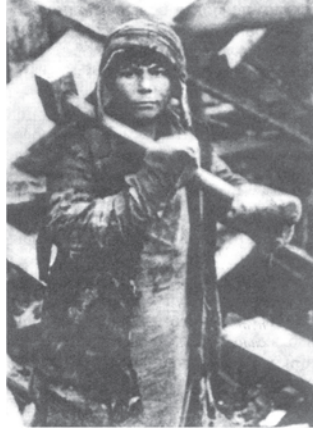
شکل 16: پہلے پانچ سالہ منصوبے کے دوران ماگنی ٹوگورسک میں ایک بچہ: وہ سوویت روس کی خاطر محنت کر رہا ہے۔