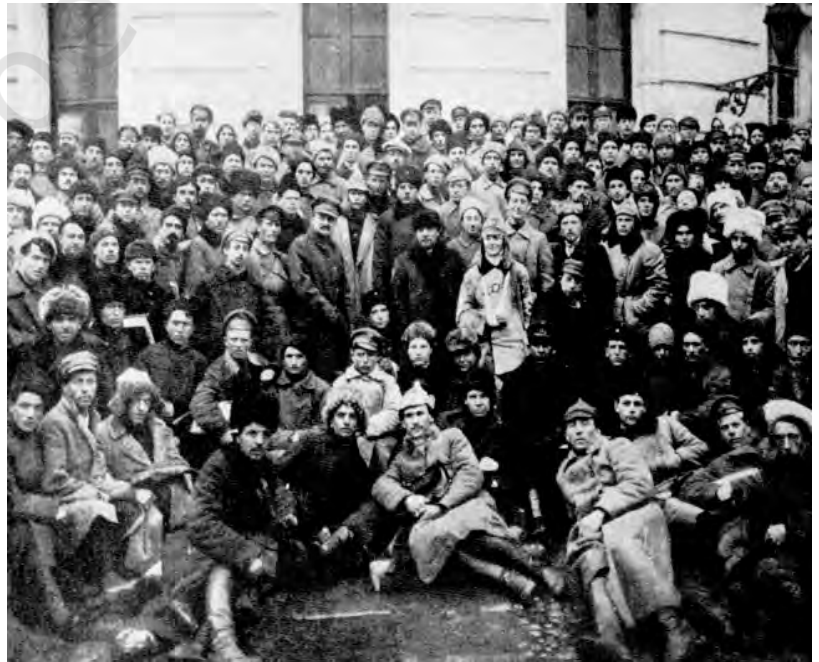
شکل 11: پیٹر وگراڈ کے مزدوروں کے ساتھ لینن (بائیں) اور ٹراٹسکی (دائیں)۔

24 اکتوبر کو بغاوت کی ابتدا ہوئی۔ مستقبل میں آنے والی پریشانی کو محسوس کرتے ہوئے وزیر اعظم کرنسکی نے فوجی ٹکڑیاں طلب کرنے کے لیے شہر چھوڑ دیا۔ صبح سویرے ان فوجیوں نے جو حکومت کے وفادار تھے دو باشوکی اخباروں کی عمارت پر قبضہ کر لیا۔ ٹیلی فون اور ٹیلی گراف دفاتروں پر قبضہ کرنے اور ونٹر پلیس کی حفاظت کرنے کے لیے سرکاری حامی فوجی بھیجے گئے۔ اس فیصلے پر تیزی سے عمل کرتے ہوئے فوجی انقلابی کمیٹی نے اپنے حامیوں کو سرکاری دفاتر پر قبضہ کرنے اور وزراء کو گرفتار کرنے کا حکم دیدیا۔ اسی دن بعد میں جنگی جہاز اور اورا (Aurora) نے ونٹر پلیس پر بمباری کر دی۔ اس کے بعد مزید سمندری جہاز نیوا (Neva) ندی سے گذرتے ہوئے مختلف ٹھکانوں پر قابض ہو گئے۔ رات تک شہر کمیٹی کے قبضے میں آ گیا اور وزراء نے خود سپردگی کر دی۔ پیٹر وگراڈ میں، سوویتوں کی کل روسی کانگریس کی بیٹھک میں، اکثریت نے باشوکی کارروائی کی تائید کی۔ دوسرے شہروں میں بھی شورشیں ہوئیں۔ خاص طور سے ماسکو میں زبردست جنگ جاری تھی لیکن دسمبر آنے تک باشوکیوں نے ماسکو پیٹر وگراڈ علاقے پر قبضہ جمالیا تھا۔