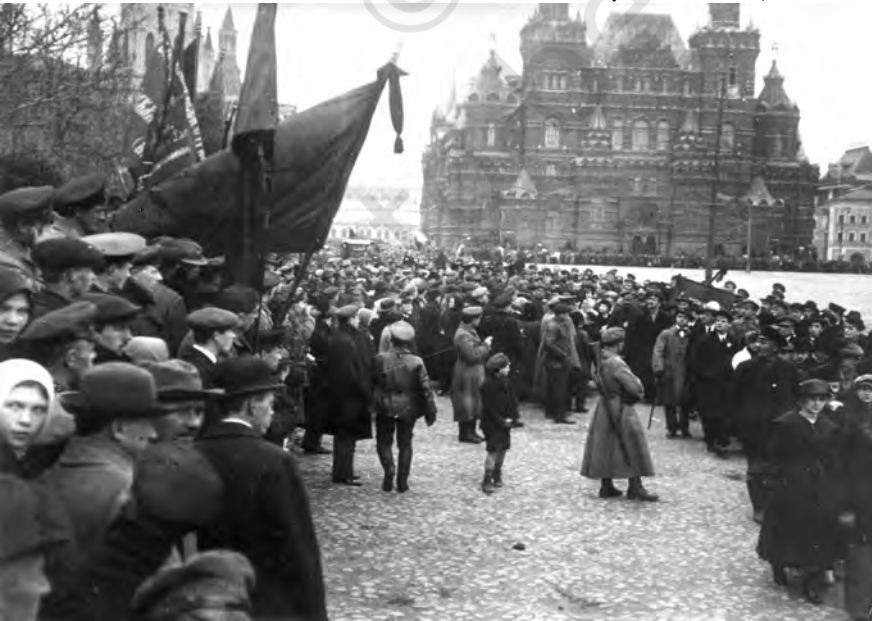
شکل 13: 1918 میں ماسکو میں یوم مٹی کا مظاہرہ۔

باشوویک پارٹی کا نام بدل کر روسی کمیونسٹ پارٹی (باشوویک) رکھا گیا۔ نومبر 1917 میں باشوویکوں نے دستور ساز اسمبلی کے لیے انتخابات کرائے لیکن ان میں ان کو اکثریت حاصل نہ ہو سکی۔ جنوری 1918 میں اسمبلی نے باشوویک اقدامات کو مسترد کر دیا اور لینن نے اسمبلی کو برخاست کر دیا۔ لینن کا خیال تھا کہ غیر یقینی حالات میں چنی گئی اسمبلی کے مقابلے کل روسی سویت کانگریس کہیں زیادہ جمہوری تنظیم تھی۔ مارچ 1918 میں دوسرے سیاسی اتحادیوں کی مخالفت کے باوجود باشوویکوں نے بریست لٹووسک (Brest Litovsk) میں جرمنی کے ساتھ امن کا معاہدہ کیا۔ آئندہ سالوں میں، باشوویک پارٹی سوویت کی کل روسی کانگریس کے انتخابات میں حصہ لینے والی واحد جماعت رہ گئی۔ کل روسی کانگریس کو پارلیمنٹ کا درجہ دے دیا گیا۔ روس یک پارٹی ریاست بن گیا۔ خفیہ پولیس نے (جو پہلے