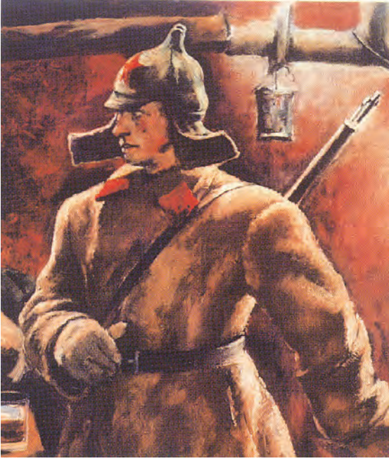
شکل 12: سوویت ہیٹ (بودیونو کا) پہننے ایک فوجی

باشوکی نئی ملکیت کے پورے طور سے مخالف تھے۔ نومبر 1917 میں زیادہ تر صنعتیں اور بینک قومیا لیے گئے۔ اس کا یہ مطلب تھا کہ حکومت ملکیت اور انتظامیہ دونوں پر قابض ہوگئی۔ زمین کو سماجی جائیداد بنانے کا اعلان ہوا اور امراء کی زمین پر قبضہ کرنے کے لیے کسانوں کو اجازت دیدی گئی۔ شہروں میں باشوویکیوں نے خاندانی ضروریات کے مطابق بڑے بڑے مکانوں کی تقسیم کی اور تقسیم کا منصوبہ نافذ کیا۔ انہوں نے روزانہ زندگی میں ہونے والی علامتوں کو بدل کر رکھ دیا۔ انہوں نے طبقہ اشرافیہ کے پرانے خطابات کا استعمال ممنوع کر دیا۔ اس تبدیلی پر زور دینے کے لیے 1918 میں منعقد ایک مقابلے کے بعد فوجیوں اور اور سرکاری ملازموں کے لیے نئی وردیاں بنائی گئیں جس کے تحت مخصوص ٹوپی بودیونو کا (budeonovka) کا انتخاب ہوا۔