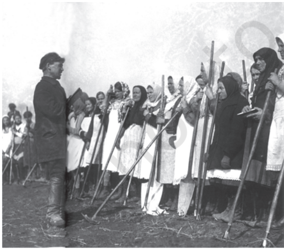
شکل 19: بڑے بڑے اجتماعی فارموں پر کام کرنے کے لیے جمع عورتیں۔

ڈیپورٹڈ: کسی کو اپنے ملک سے زبردستی جلاوطن کرنا جلاوطنی: کسی کو اپنے ملک سے باہر ہونے کو مجبور کرنا