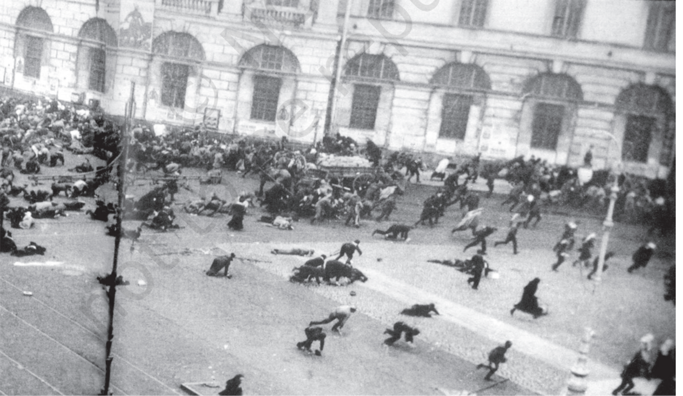
شکل 10: جولائی کے دن: 17 جولائی 1917 کو باشوکی حامی احتجاج پر گولیاں برساتی فوج۔

جب عارضی حکومت اور باشوکیوں کے درمیان اختلافات بڑھے، لینن کو اس بات کا خوف ہوا کہ عارضی حکومت آمریت قائم کر دے گی۔ ستمبر میں اس نے حکومت کے خلاف بغاوت شروع کرنے کے