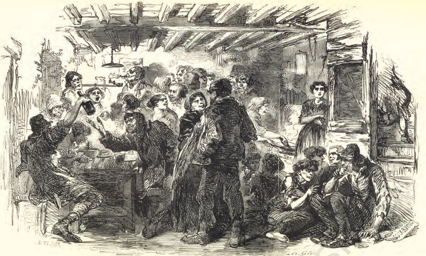
شکل 1: عصری فنکار کی نظر میں انیسویں صدی کے وسط میں لندن کے غریب لوگ لندن کے مزدور اور لندن کے غریب لوگ، 1861ء - ہینری مے ہیو کی مصوری

رہے تھے روشن خیال اور ریڈیکلز ان مسائل کا حل تلاش کر رہے تھے۔