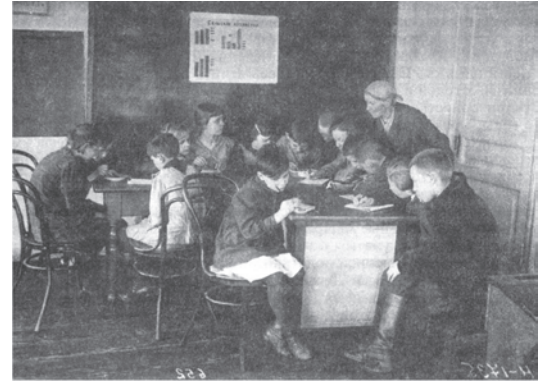
شکل 15: 1930 کے عشرے میں سوویت روس کے اسکول میں بچے: وہ سوویت معیشت کا مطالعہ کر رہے ہیں۔