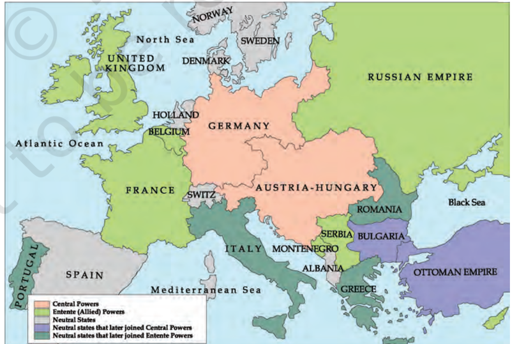
شکل 4: 1914 میں یورپ: (یہ نقشہ پہلی عالمی جنگ میں شامل روسی سلطنت اور یورپین ممالک کو دکھاتا ہے)