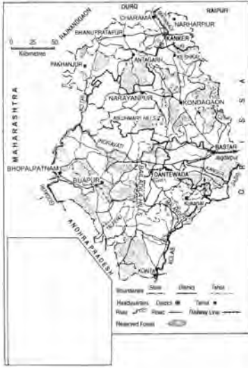
شکل 20، 2000 میں بستر کا نقشہ

1947 میں ریاست بستر کو کانکر ریاست کے ساتھ شامل کیا گیا اور یہ مدھیہ پردیش کا ایک ضلع بن گیا۔ 1998 میں اس کو دوبارہ کانکر، بستر اور دانتے واڑہ نام کے تین اضلاع میں بانٹ دیا گیا۔ 2001 میں یہ اضلاع چھتیس گڑھ کا حصہ بن گئے۔ 1910 میں بغاوت سب سے پہلے کانکر کے جنگل کے علاقے (دائرے میں) میں ہوئی اور جلد ہی ریاست کے دوسرے حصوں میں پھیل گئی۔