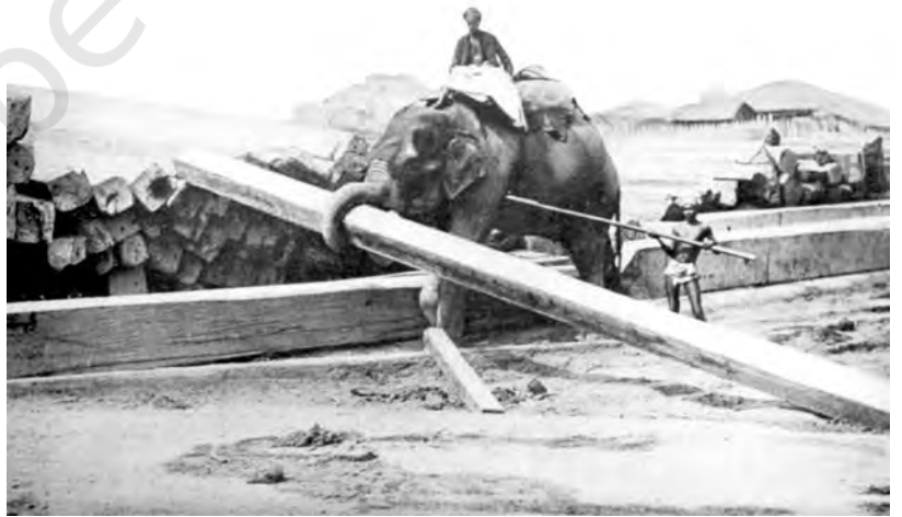
شکل 5: رنگون میں واقع ٹمبر یارڈ میں ٹمبر کے شہتیروں کا ڈھیر لگاتے ہوئے ہاتھی: نوآبادیاتی دور میں جنگلات اور ٹمبر یارڈوں دونوں سے بھاری شہتیروں کو اٹھانے کے لیے ہاتھی کے استعمال کا رواج عام تھا۔

1860 کی دہائی آنے تک ریلوے نٹ ورک میں بڑی تیزی سے توسیع ہوئی۔ 1890 کا سال آنے تک تقریباً 25,500 کلومیٹر ریلوے لائن بچھائی جا چکی تھی۔ 1946 میں ریلوے لائنوں کی یہ لمبائی بڑھ کر 7 لاکھ 65 ہزار کلومیٹر تک جا پہنچی۔ ہندوستان میں ریلوے لائنوں کی توسیع کے ساتھ ساتھ درختوں کی ایک بڑی تعداد کو اکھاڑ پھینکا گیا۔ 1850 کے دہے تک تہامد راس پریزیڈنسی ہی میں سالانہ تقریباً 35,000 پیڑ گرا دیئے گئے۔ حکومت نے مطلوبہ مقدار کی فراہمی کے لیے افراد کو ٹھیکے دیئے۔ ان ٹھیکے داروں نے اندھا دھند پیڑوں کی کٹائی شروع کر دی۔ ریلوے لائنوں کے آس پاس کے علاقے سے جنگلات تیزی سے ختم ہونا شروع ہو گئے۔