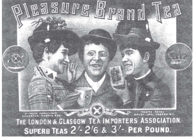
شکل 8: پلیور برانڈ چائے

یورپ میں مختلف لوگوں کی بڑھتی مانگوں کو پورا کرنے کے لیے چائے، کافی اور ربر کی شجرکاری قدرتی جنگلات کو بھی کاٹ کر کے کی گئی۔ نوآبادیاتی حکومت نے جنگلات پر قبضہ کیا اور ان کو کافی سستی قیمتوں پر یورپین شجرکاروں کے حوالے کر دیا۔ ان علاقوں کی احاطہ بندی کر کے جنگلات صاف کر دیے گئے اور ان پر چائے یا کافی کے باغات لگائے گئے۔