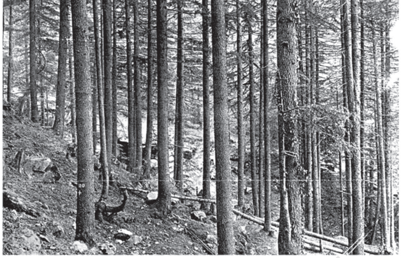
شکل 10: کانگریہ میں دیودار کی شجرکاری، انڈین فاریسٹ ریکارڈ، والیوم XV سے ماخوذ 1933

ضابطوں پر عمل کیے بغیر پیڑ کاٹنے والے کسی بھی شخص کو سزا دینی پر یسکتی تھی۔ اس کیے برانڈس نے 1864 میں انڈین فاریسٹ سروس قائم کی اور 1865 کے انڈین فارسٹ ایکٹ بنانے میں مدد کی۔ 1906 میں، دہرہ دون میں امپیریل فارسٹ ریسرچ انسٹی ٹیوٹ قائم کیا گیا۔ یہاں جن ضوابط کی تعلیم دی گئی، وہ ’سائنٹفک جنگل بانی‘ کہلائی۔ اب بہت سے لوگ نے جن میں ماہرین ماحولیات بھی شامل ہیں یہ محسوس کرتے ہیں کہ یہ ضوابط بالکل بھی سائنٹفک نہیں تھے۔