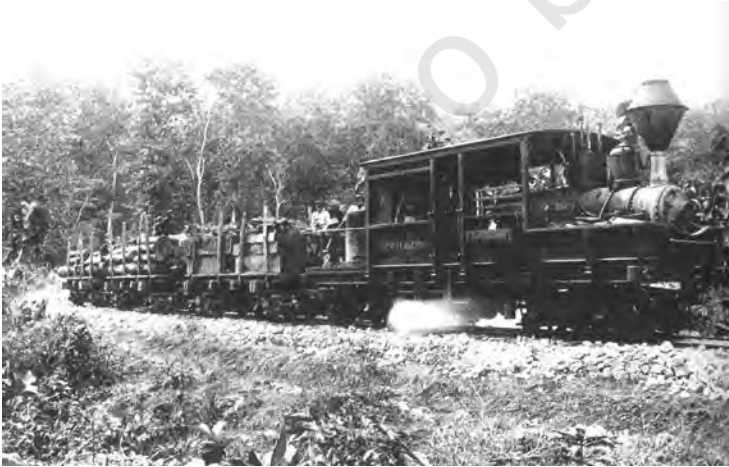
شکل 21: جنگل سے ساگوان کا نقل و حمل کرتی گاڑی۔ نوآبادیاتی زمانے کا آخری دور

ہندوستان کی طرح جہاز سازی اور ریل راستوں کی تعمیر کے لیے جنگلاتی خدمت کی ضرورت پیش آئی۔