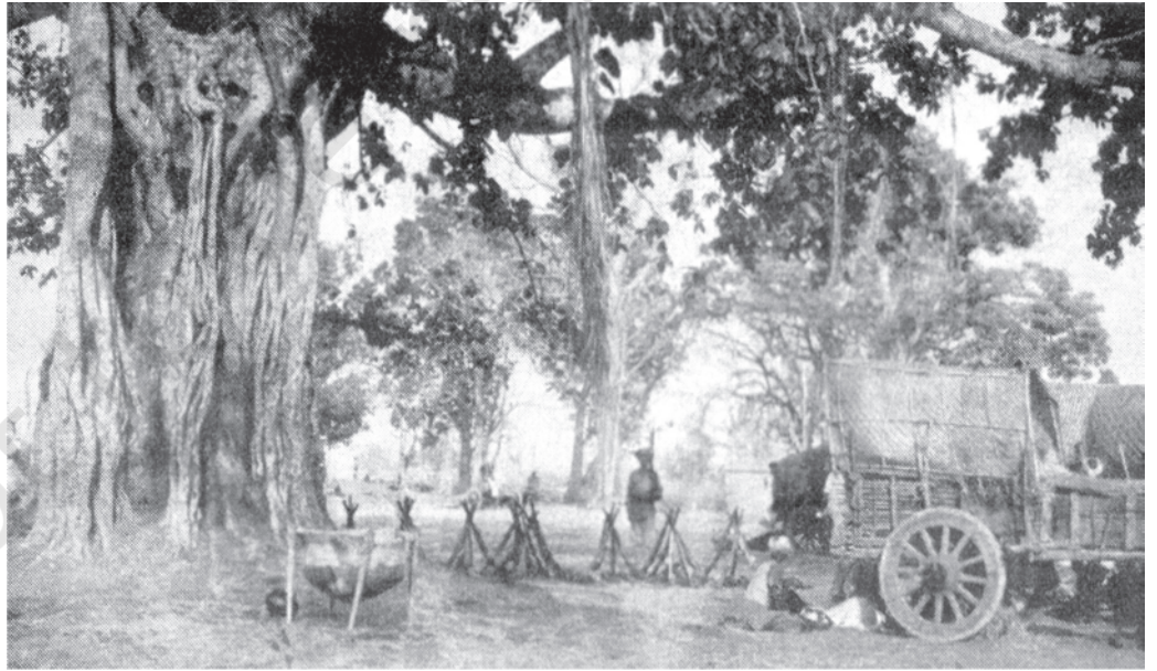
شکل 19: بستری فوجی کیمپ، 1910 فوجی کیمپ کی یہ تصویر 1910 میں لی گئی تھی۔ فوج خیموں، باورچیوں اور فوجیوں کے ساتھ چلتی تھی۔ یہاں ایک سپاہی بانٹیوں کے خلاف کیمپ کی حفاظت کر رہا ہے۔

بستری چھتیس گڑھ کے جنوب بعید میں واقع ہے اور اس کی سرحدیں آندھرا پردیش، اڈیشہ اور مہاراشٹر سے ملتی ہیں۔ بستری وسطی حصہ ایک پٹھار ہے۔ اس پٹھار کے شمال میں چھتیس گڑھ کا میدان اور جنوب میں گوداوری کا میدان ہے۔ اندراوتی ندی بستری ہو کر مشرق سے مغرب کی جانب بہتی ہے۔ ماریا، موریا، گونڈ، دھرو، بھتس اور ہلبا جیسے مختلف قبائلی فرقے بستری میں رہتے ہیں۔ یہ مختلف زبانیں بولتے ہیں لیکن ان کے اپنے رواج اور عقائد یکساں ہیں۔ بستری کے لوگوں کا عقیدہ ہے کہ دھرتی ماتا نے ہر گاؤں کو زمین دی تھی اور اس کے بدلے وہ ہر زراعتی تیار کے موقع پر کسی نہ کسی شکل میں نذرانہ پیش کرتے ہوئے زمین کی دیکھ بھال کرتے ہیں۔ وہ ندی، جنگل اور پہاڑ کی آتماؤں کا احترام کرتے ہیں۔