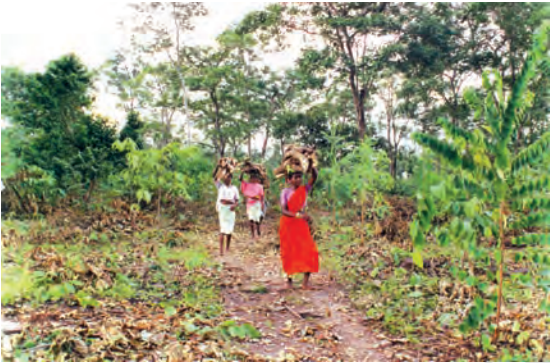
شکل 6: ایندھن کی لکڑی جمع کرنے کے بعد گھر واپس لوٹی عورتیں

ای۔ پی۔ اسٹیننگ: ہندوستان کے جنگلات (فارسٹس آف انڈیا) والیوم II (1923)