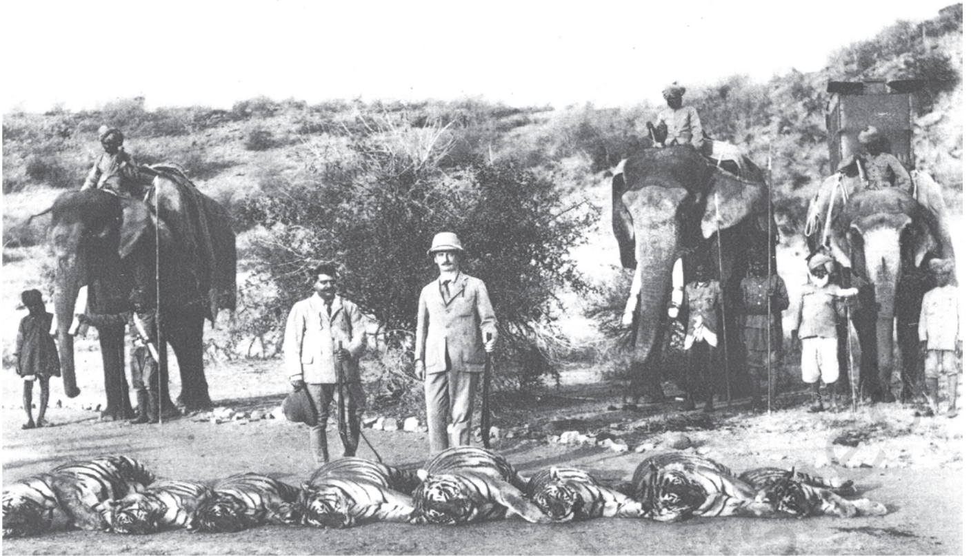
شکل 18: نپال میں شکار کرتے ہوئے لارڈ ریڈنگ۔

اس فوٹو میں مرے ہوئے ٹائیگر لگنے۔ جب نوآبادیاتی دور کے افسران اور راجا شکار کرنے جاتے تھے تو ان کے ساتھ ملازموں کی ایک پوری ٹیم ہوتی تھی۔ گاؤں کے ماہر شکاری شکار کی کھوج کرتے تھے اور صاحب تو صرف گولی چلاتے تھے۔