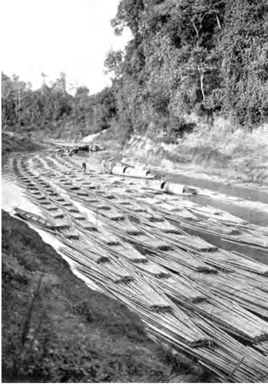
شکل 4: کسالانگ دریا میں بہتے ہوئے بانس کے بندل، چٹاگانگ پہاڑی پٹی

انیسویں صدی کے ابتدائی حصے تک انگلینڈ کے اندر موجود شاہ بلوط کے درختوں کے جنگلات ختم ہو رہے تھے۔ اس کی وجہ سے شاہی بحریہ کے لیے ٹمبر (عمارتی لکڑی) فراہم کرنے کا مسئلہ درپیش ہوا۔ مسئلہ یہ تھا کہ موجودہ صورت میں مضبوط اور دیرپا ٹمبر کی باقاعدہ فراہمی کے بغیر برطانیہ کے لیے سمندری جہازوں کی تعمیر کس طرح ہو؟ سمندری جہازوں کے بغیر شاہی اقتدار کا تحفظ کس طرح ہو اور اُسے برقرار کس طرح رکھا جائے؟ 1820 کی دہائی تک، ہندوستان کے جنگلاتی وسائل کی کھوج کے لیے تلاش پارٹیاں بھیجی گئیں۔ دس سال کے اندر اندر بھاری پیمانے پر پیڑوں کو کاٹا گیا اور ٹمبر کی ایک بڑی تعداد کی برآمد ہندوستان سے ہونے لگی۔