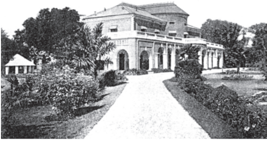
شکل 11: امپیریل فارسٹ اسکول، دہرہ دون، انڈیا۔ جنگل بانی کے پہلے اسکول کا افتتاح برٹش سلطنت میں ہوا تھا۔ انڈین فاریسٹ، والیوم XXXI سے ماخوذ۔

جنگلات کے محافظ اور گاؤں والوں کا اس مسئلہ پر اختلاف تھا کہ جنگل کیسا ہونا چاہیے۔ گاؤں والے یہ چاہتے تھے کہ جنگلات میں اپنی ضروریات کو پورا کرنے کے لیے مصالحے، ایندھن چارہ اور پیتیاں ملی جلی ہونی چاہئیں۔ اس کے برعکس محکمہ جنگلات ایسے درخت چاہتا تھا جو جہاز سازی اور ریلویز بنانے میں موزوں ہوں۔